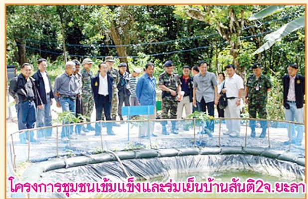
โครงการชุมชนเข้มแข็งและร่วมเย็นบ้านสันติ2จ.ยะลา