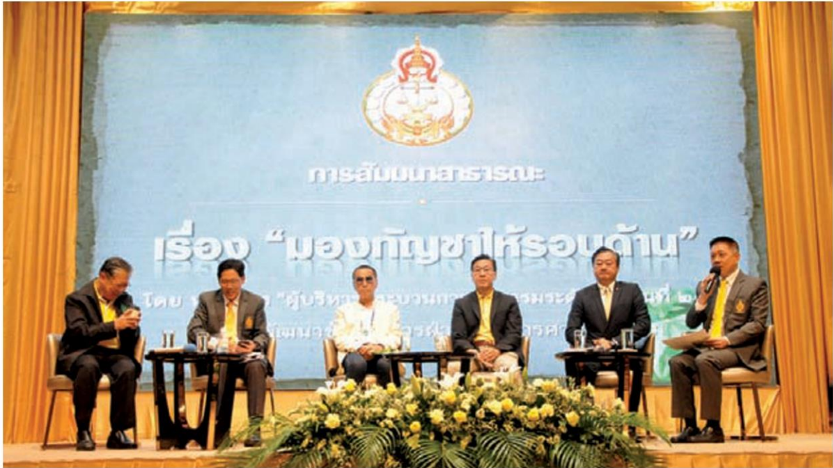
ผู้เชี่ยวชาญร่วมถก ผ่านหัวข้อ “มองกัญชาให้รอบด้าน”