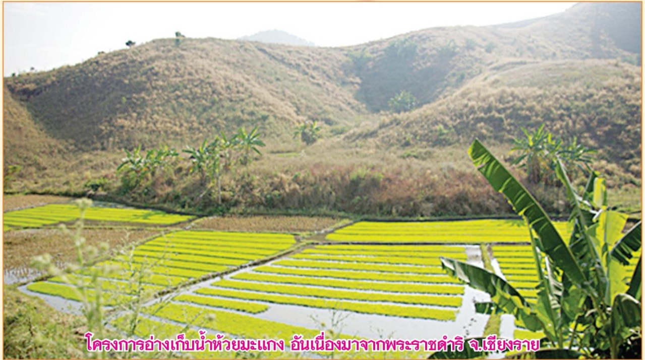
โครงการอ่างเก็บน้ำห้วยมะแกง อันเนื่องมาจากพระราชดำริ จ.เชียงราย

โอกาสที่ได้ทรงดำรงพระอิสริยยศคือเป็นสยามมกุฎราชกุมาร เมื่อวันที่ 29 ธันวาคม พ.ศ.2515 ความว่า